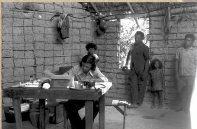
1974 – Atividades da equipe do Projeto Rondon