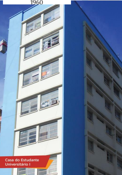
Casa do Estudante Universitário I

União Universitária – provisória – 280 moradores