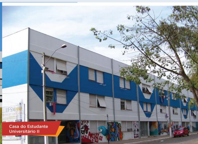
Casa do Estudante Universitário II