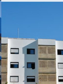
Casa do Estudante Frederico Westphalen