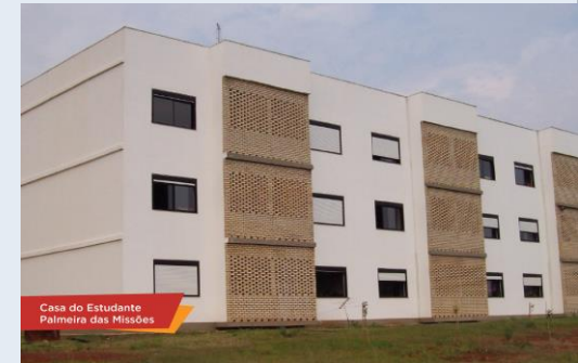
Casa do Estudante Palmeira das Missões