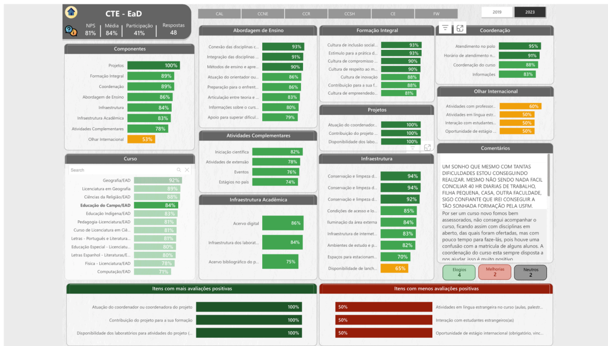
Figura 3 - Avaliação Geral por Curso - Curso de Licenciatura em Educação no do Campo EAD