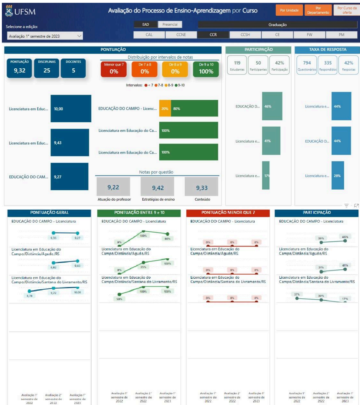
Figura 4 - Avaliação do Processo de Ensino-Aprendizagem do Curso de Educação do Campo EaD.