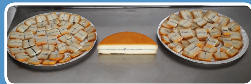
Relato e imagens: Dejanir Pissinin.