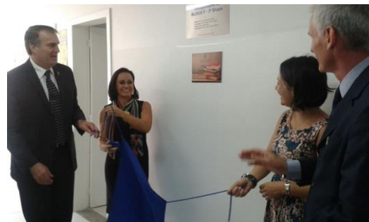
Apresentação da placa de inauguração da Biblioteca