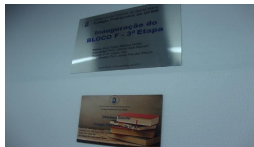
Placas presentes na entrada da Biblioteca Setorial