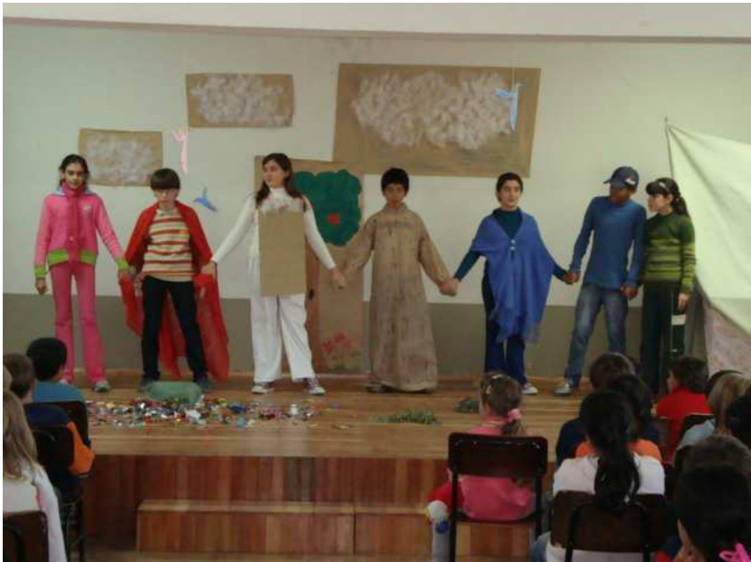
Alunos do Currículo - encenação com o tema "lixo"