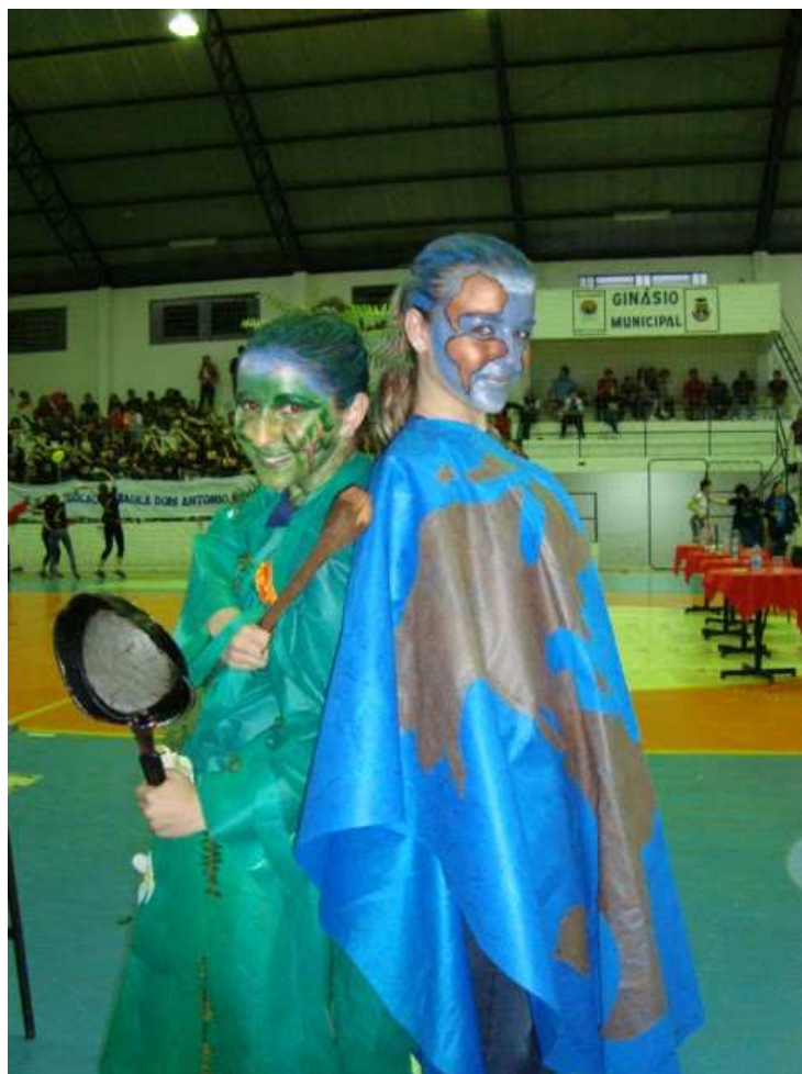
Participação da E.E.E.Básica João XXIII na GINCOPEIES em Faxinal do Soturno/ parceria E.E.D. Antônio Reis/ UFSM - Encenação "O Planeta Corre Perigo"