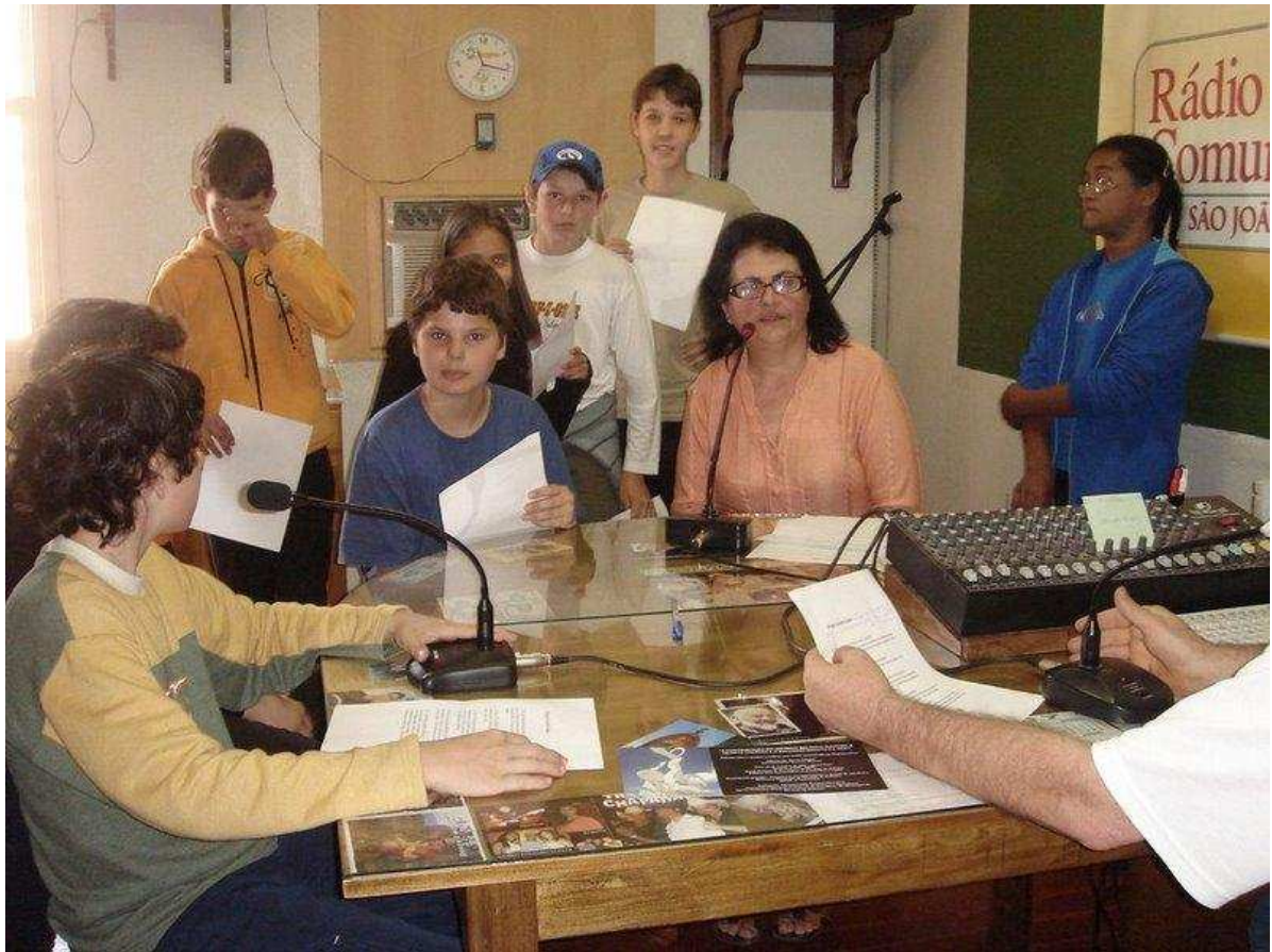
Alunos do Ensino Fundamental divulgando o Projeto na Rádio Comunitária São João FM