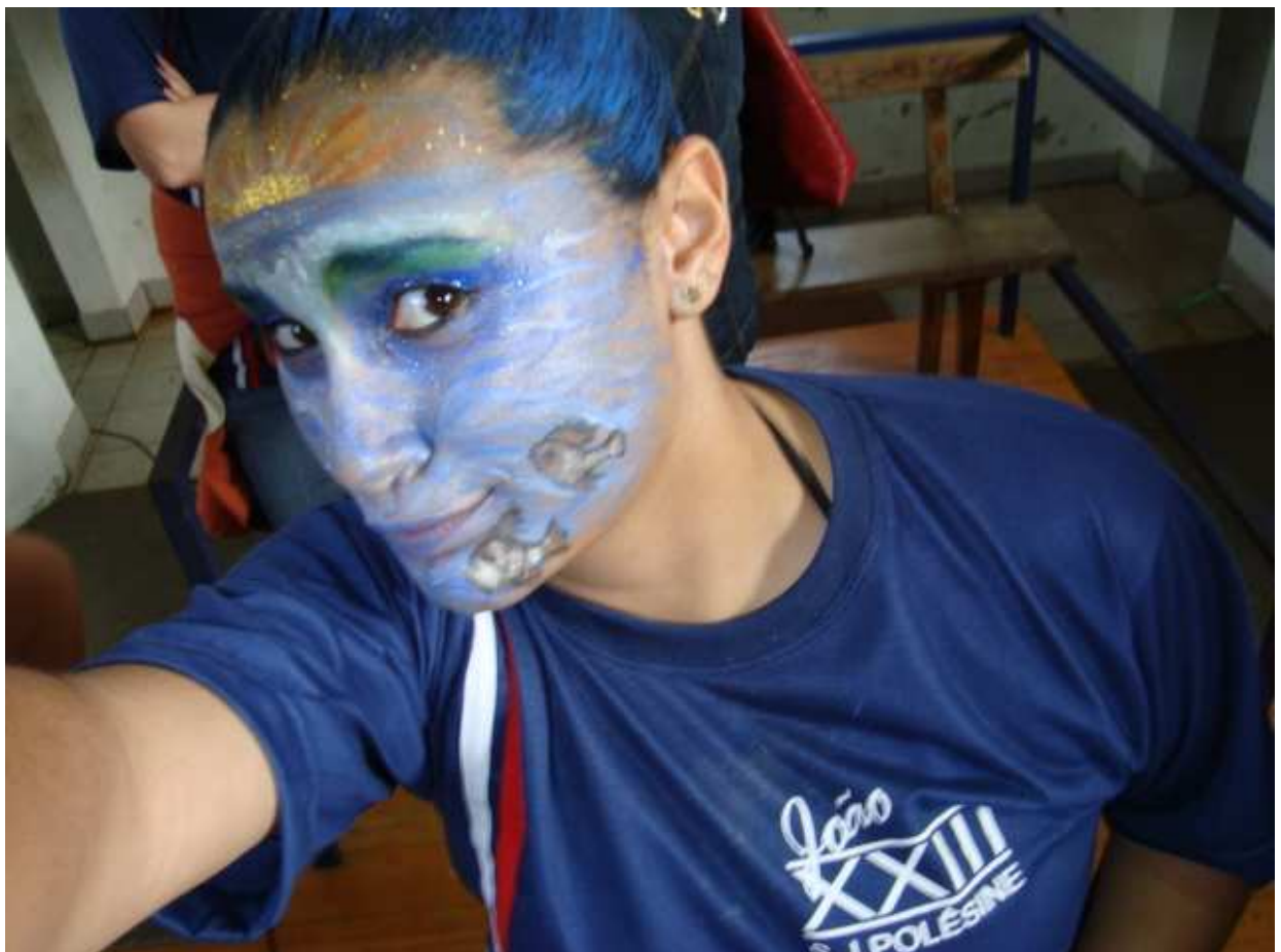
Participação da E.E.E.Básica João XXIII na GINCOPEIES em Faxinal do Soturno/ parceria E.E.D. Antônio Reis/ UFSM - Encenação "O Planeta Corre Perigo"