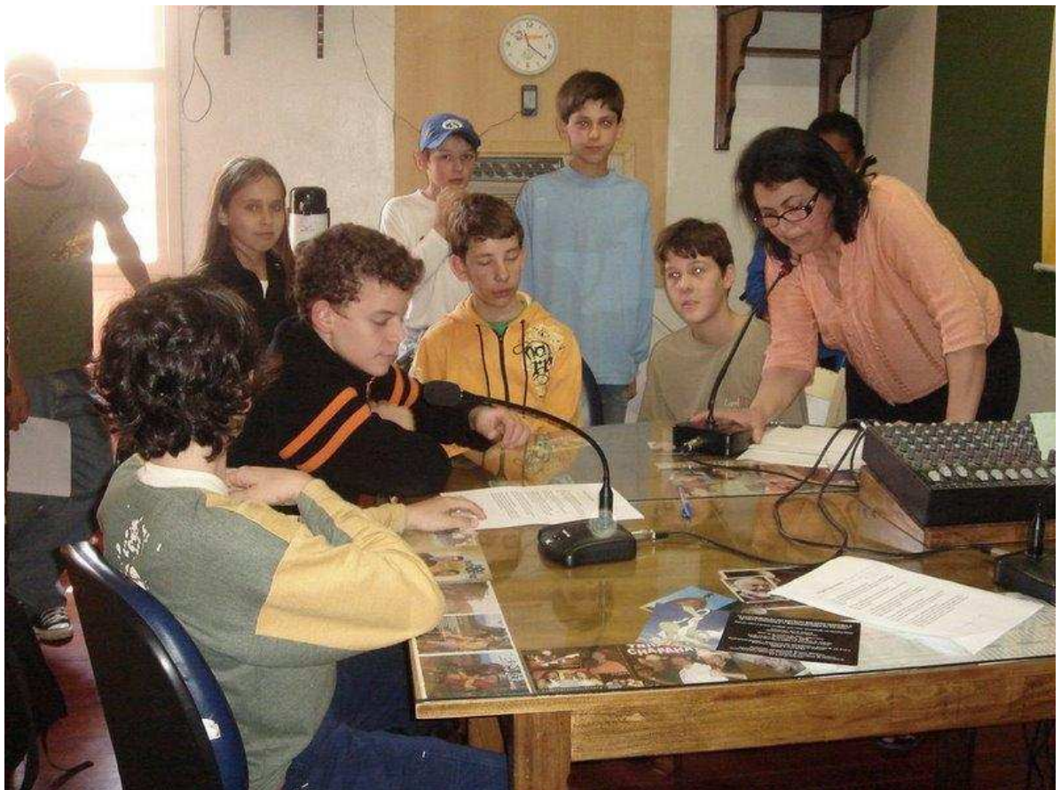
Alunos do Ensino Fundamental divulgando o Projeto na Rádio Comunitária São João FM