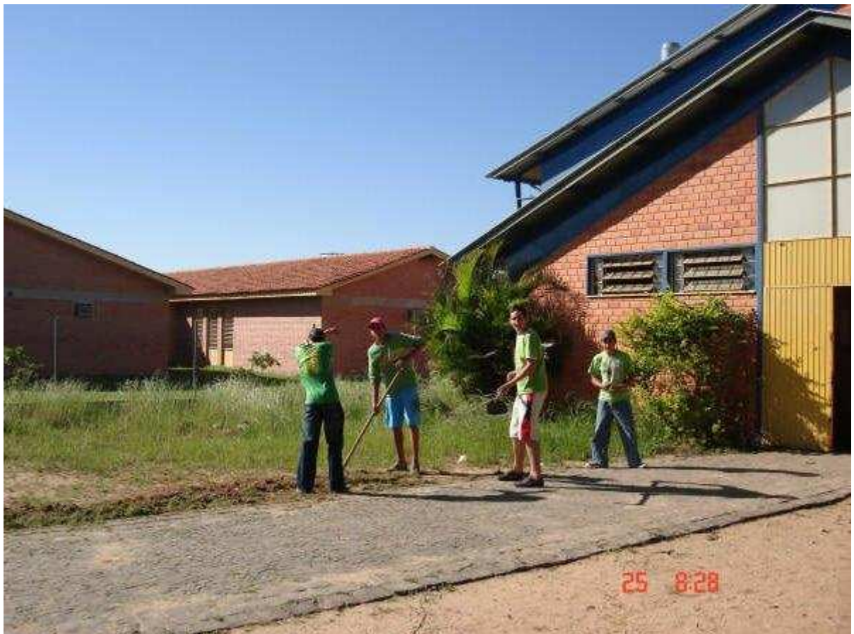
Alunos do Ensino Fundamental embelezando a frente do Ginásio Poliesportivo