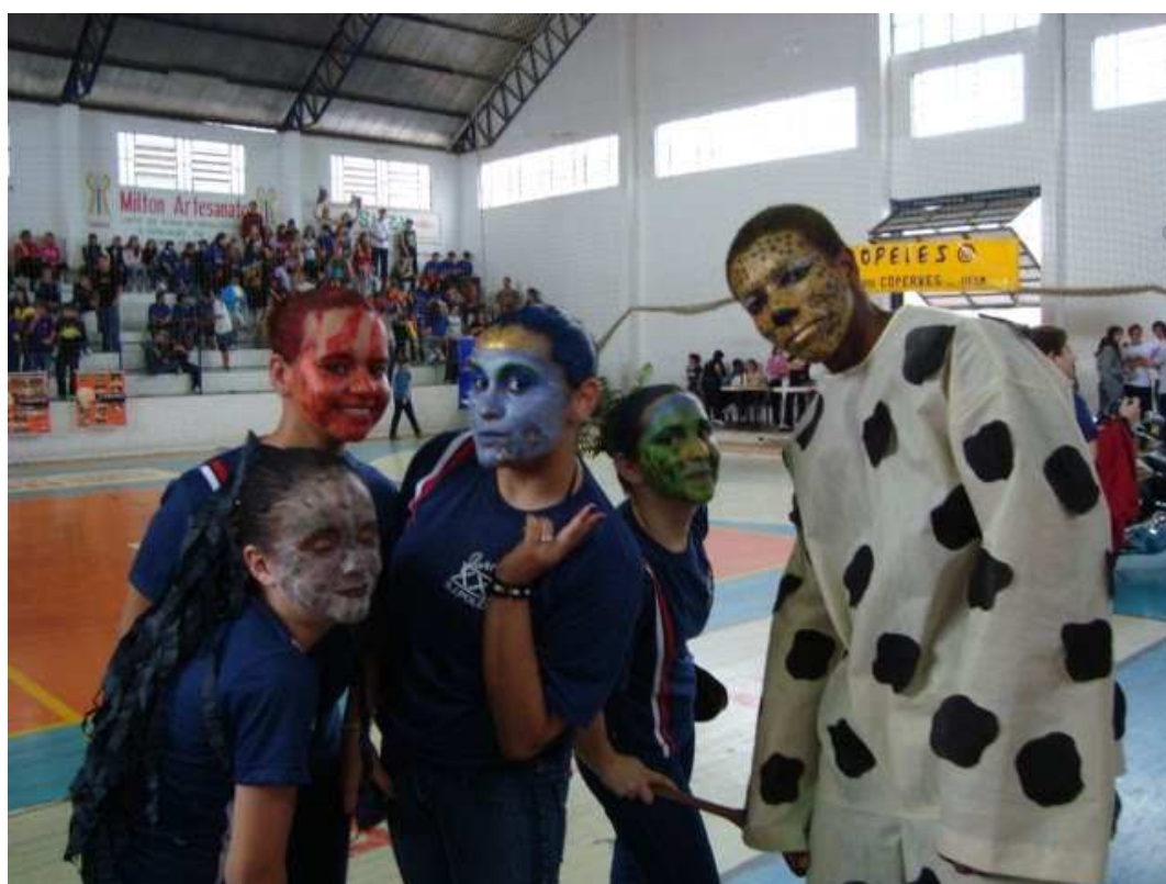
Participação da E.E.E.Básica João XXIII na GINCOPEIES em Faxinal do Soturno/ parceria E.E.D. Antônio Reis/ UFSM - Encenação "O Planeta Corre Perigo"