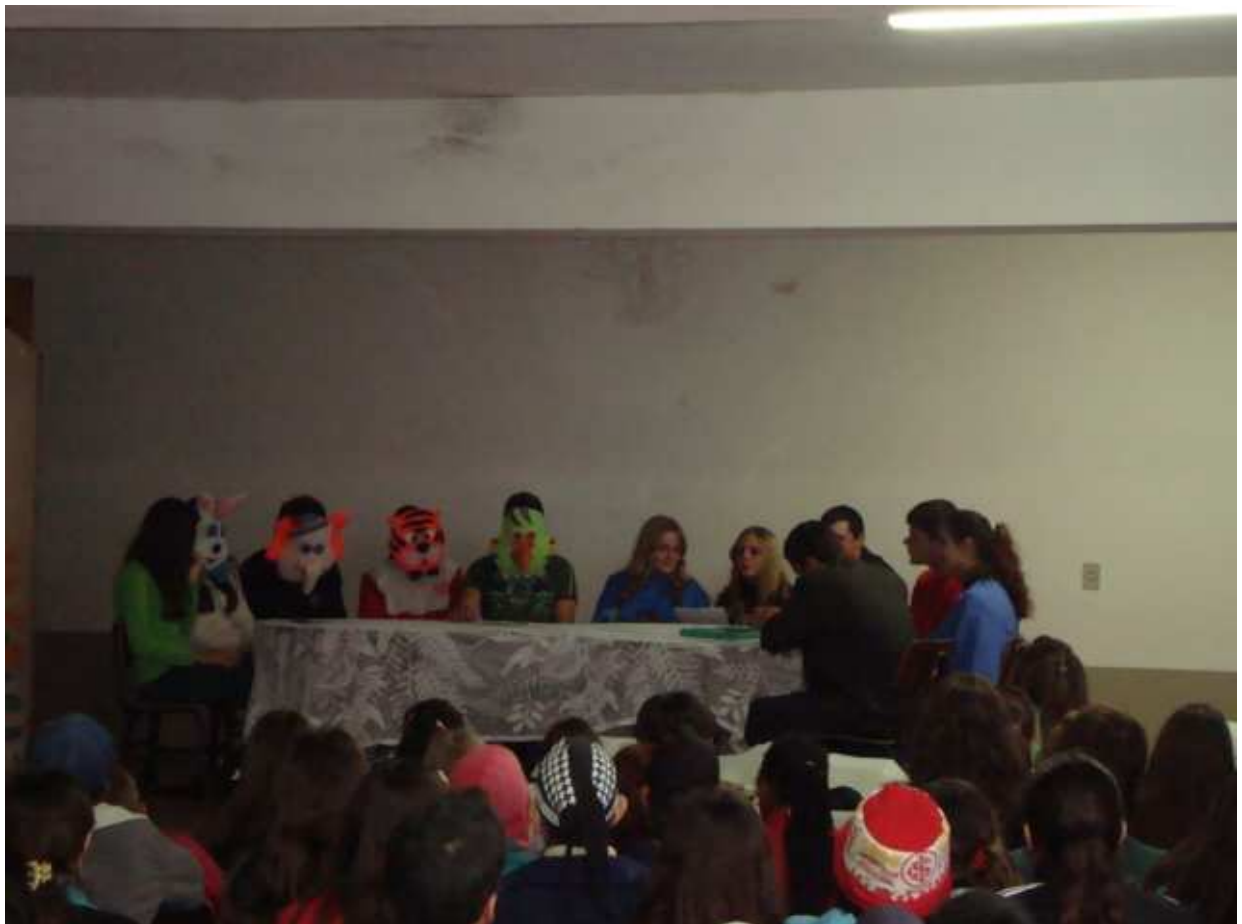
Alunos do Ensino Médio - encenação "O Planeta Corre Perigo"