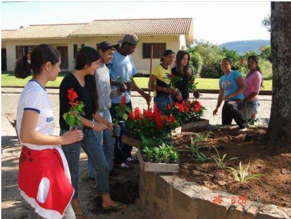
Alunos do Ensino Fundamental embelezando a frente do Ginásio Poliesportivo