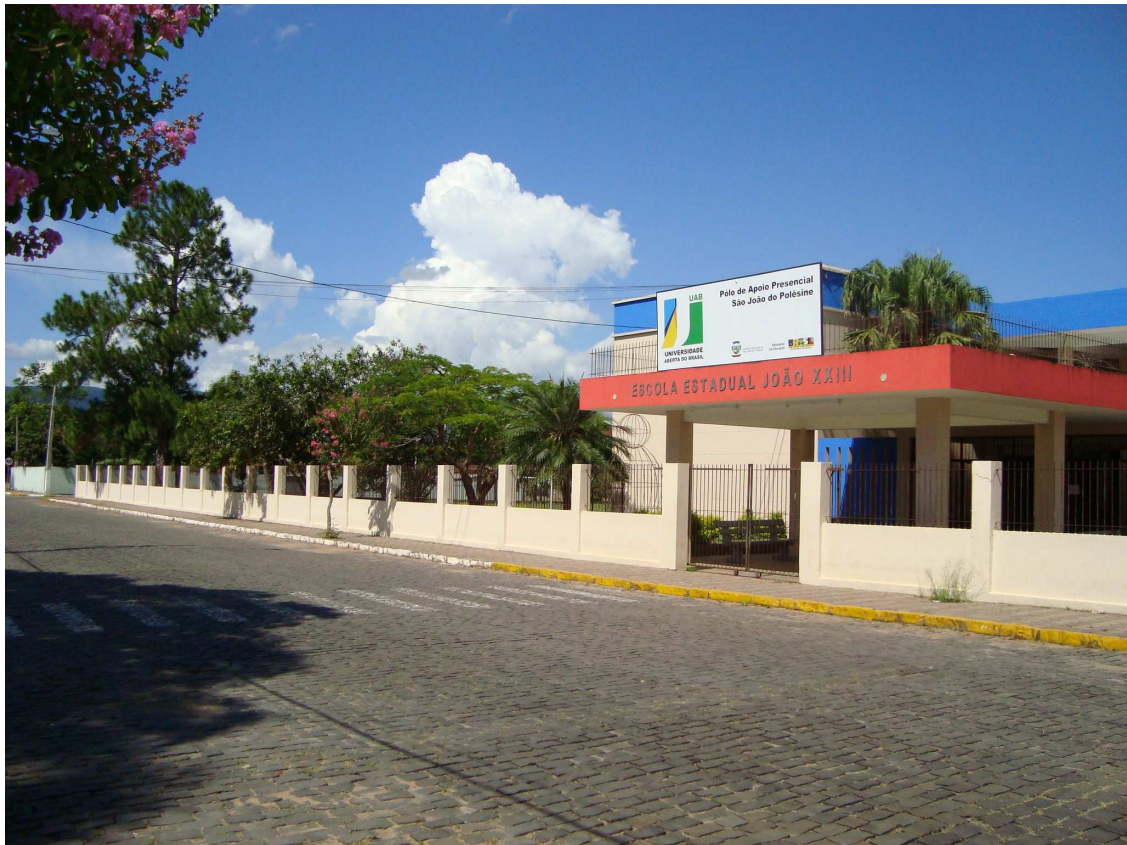
Prédio da E.E.E.Básica João XXIII