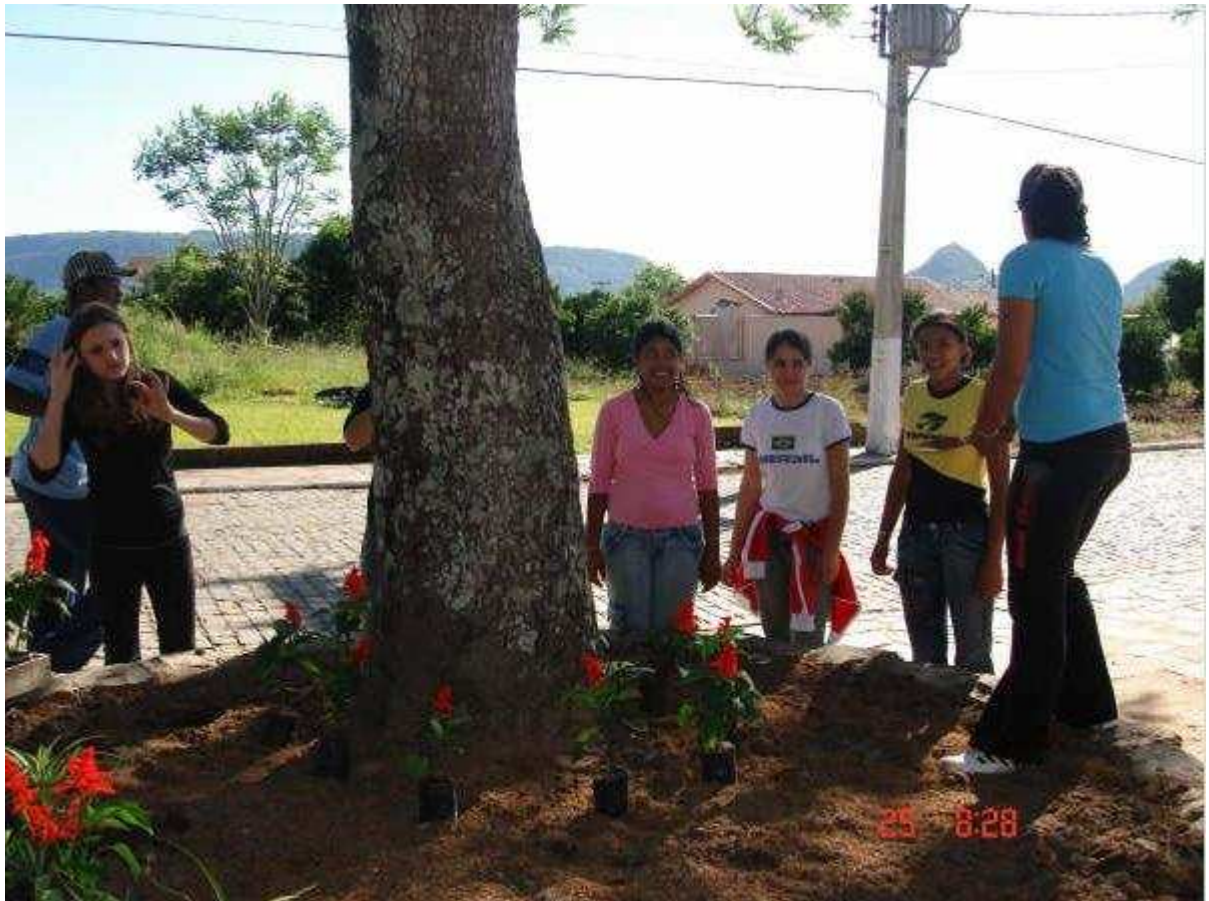
Alunos do Ensino Fundamental embelezando a frente do Ginásio Poliesportivo