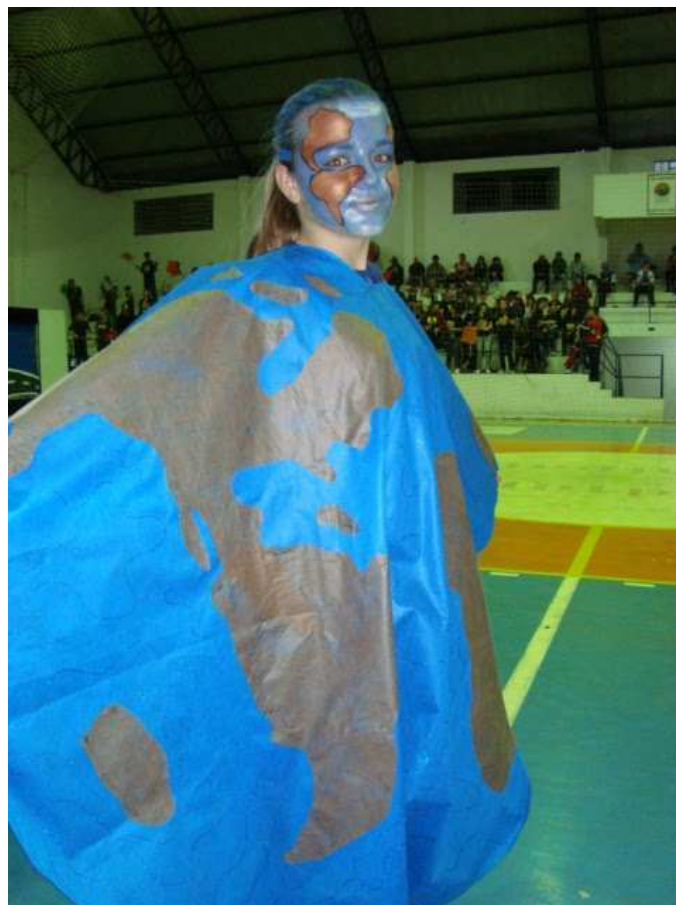
Participação da E.E.E.Básica João XXIII na GINCOPEIES em Faxinal do Soturno/ parceria E.E.D. Antônio Reis/ UFSM - Encenação "O Planeta Corre Perigo"