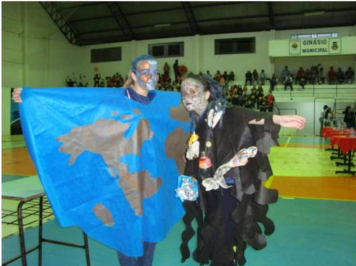
Palestra do Profº Afrânio/UNIFRA "Ações Antrópicas e recursos hídricos"