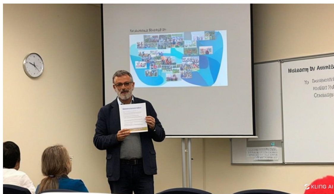
Figura 2: Foto da apresentação da palestra dia 21/08/2024